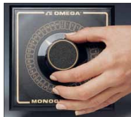
MONOGRAM®シリーズ、 金めっき接点

2極SWおよびOSWシリーズのスイッチは便利な「オフ」ポジションがあります。「オフ」ポジションは開回路にしておいたり、またはスプリアス信号が熱電対装置に記録されるのを防ぐために短絡することができます。各ポールは完全に絶縁されています。迅速で簡単な配線のために、スイッチ後部にある端子は目立つように示されています。