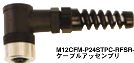
M12CFM-P24STPC-RFSR-MINIDIN-3 ケーブルアッセンブリ