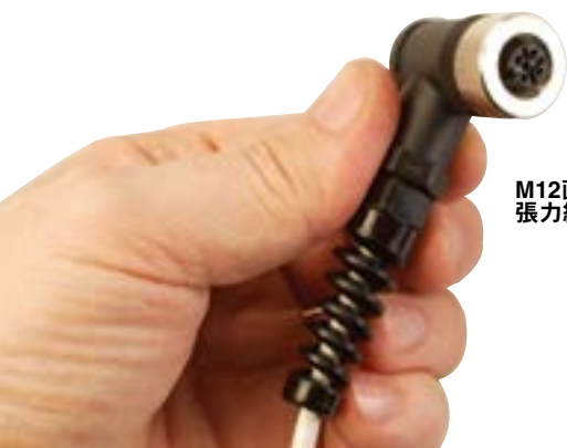
M12直角ソケットコネクタ 張力緩和装置付