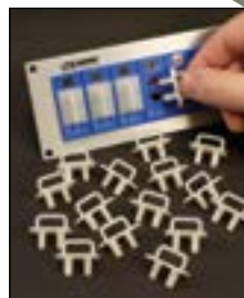
別売の12ワイヤ ケーブルクランプ (JB-CC)の標準サイ ズSPJ-CAP-12個入 (別売)