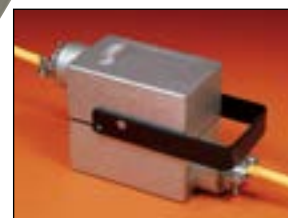
ワイヤとケーブルクランプは別売