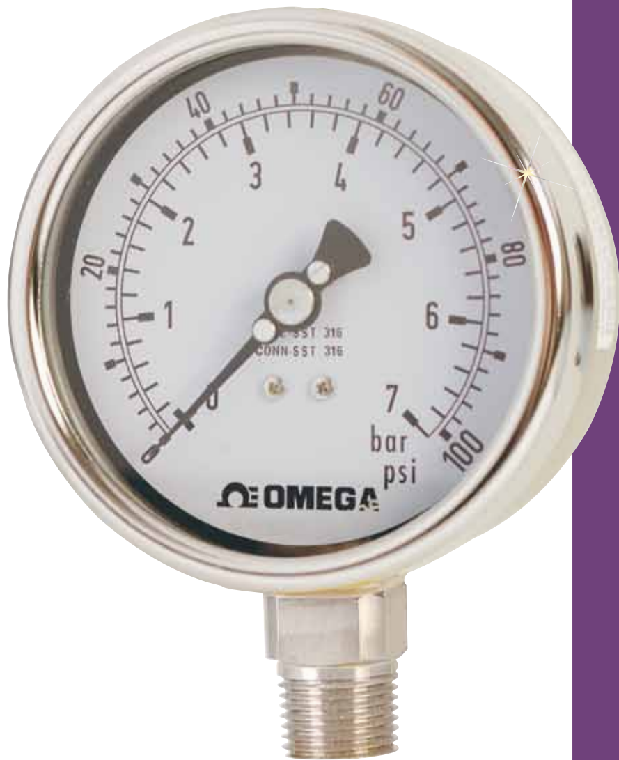
PGM-100L-100PSI/7BAR. 下部マウント取り付け、 実寸大。