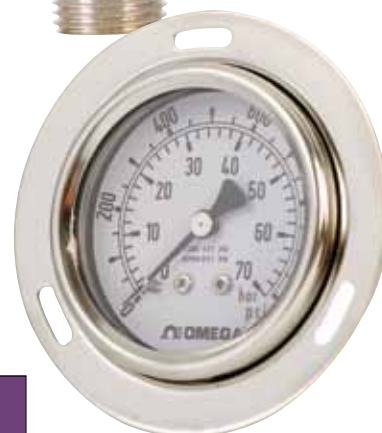
PGM-63B-1000PSI/70BAR. フランジマウントおよび背面 マウント取り付け、実物より小 さく表示。