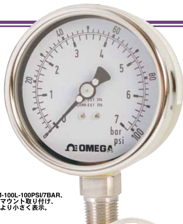
PGM-100L-100PSI/7BAR. 下部マウント取り付け、 実物より小さく表示。