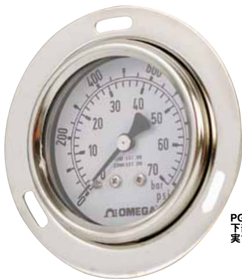
PGM-63B-1000PSI/70BAR. 下部マウント取り付け、 実寸大。