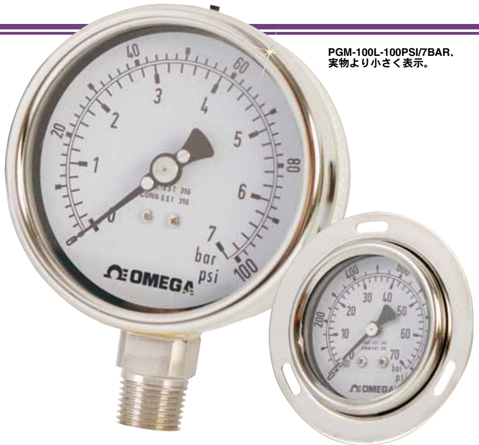
PGM-100L-100PSI/7BAR. 実物より小さく表示。

PGM シリーズはフィールドで液体充填可能です。液体充填圧力計を使えば、特定の用途で多くの利点があります。ポンプ、コンプレッサー、工作機械等、過度の振動がある機器適しています。液体の充填によってこれらの厳しい環境の影響を最小化し、圧力計内部を保護し、機器内の潤滑を維持し、寿命を延ばします。また、液体を充填することは腐食性の空気から圧力計内部を保護するのに大いに役立ちます。圧力計はグリセリン、鉱油、シリコンオイル等、様々な液体で充填できます。