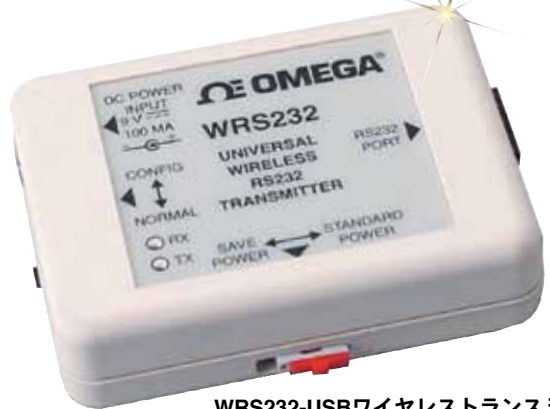
WRS232-USBワイヤレストランスミッター、写真は実物に近い大きさ。