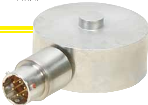
LC315/LCM315モデル ツイストロックコネクター付き。