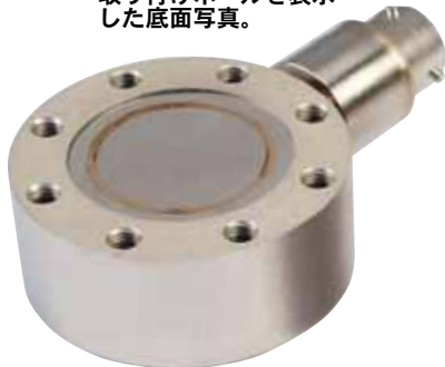
LC305/LCM305モデル 3 m (10') ケーブル付き。