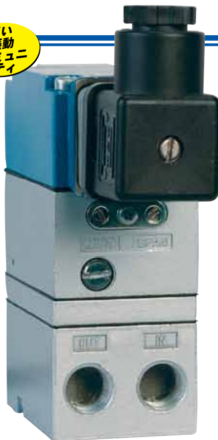
IP710-X100-D、および DIN電気端末。実物大