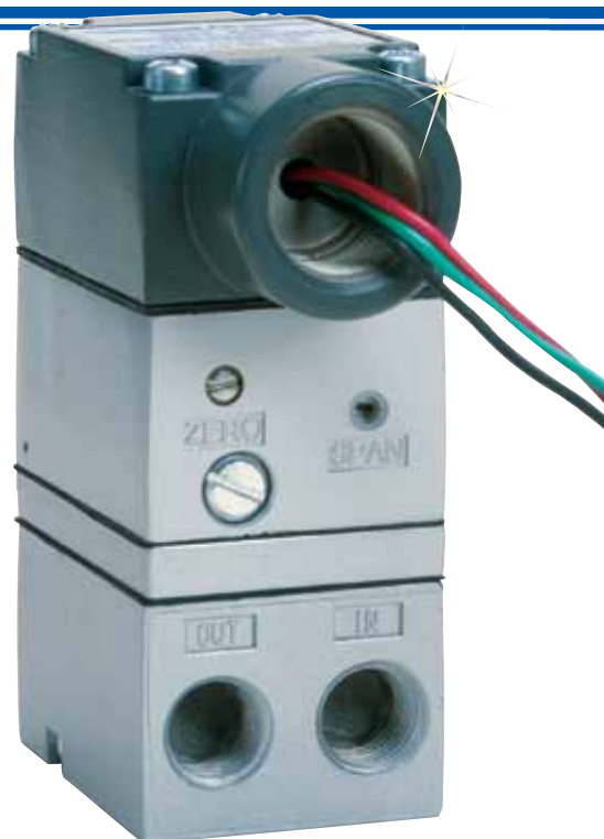
IP610-X60、および コンジ ット電 氣的端 末実物 大。

IP610は、アクチュエーター、バルブ、ポジショナーおよびその他の最終的な制御エレメント向けに精密な空気圧調整を行う、経済的な調整器です。