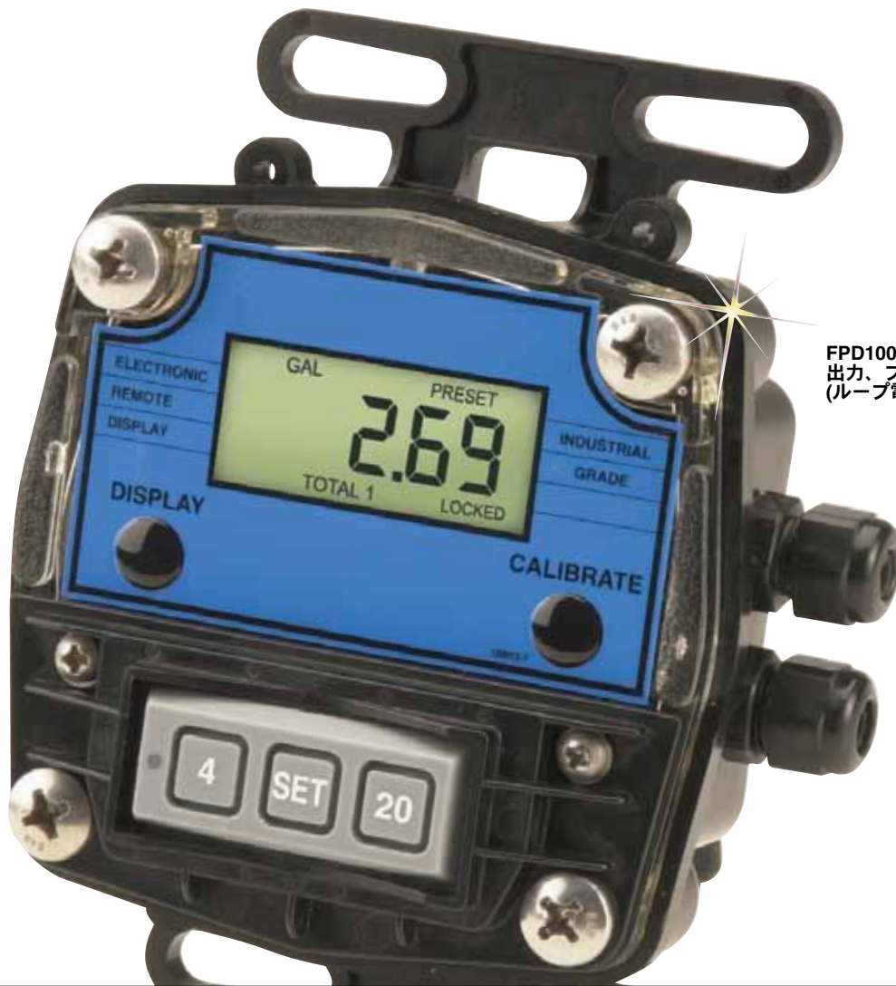
FPD1000D-TX、リモート式 4~20 mA 出力、プログラム可能ディスプレイ (ループ電源)、実物より小さく表示