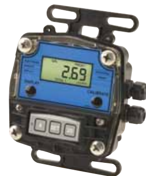
FPD1000D-TX、リモート、4~20 mA出力、プログラム可能ディスプレイ(ループ電源)、実物より小さく表示