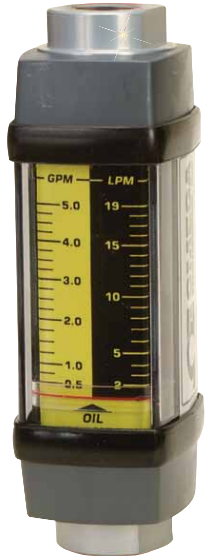
FL-6105A、実物より小さく表示

精度：±2% FS 反復率：±1% 接続：½ FNPT 寸法：116°C (240°F) 用装置の場合、60.96 x 53.34 mm (2.4 x 2.1") 長さ：すべての装置で168 mm (6.6") 最大圧力：241.3 bar (3500 psig) 最高温度： 標準：116°C (240°F) オプション：204°C (400°F) 出荷時の重量： 油：0.57 kg (1.25 ポンド) 水：1.18 kg (2.60 ポンド) 接液部：302 SS (油用装置) または302 SS (水用装置) 製ばね、FKM製Oリング、ポリフェニレン硫化物/セラミック製磁石 油用装置はアルミニウム製本体、水用装置は真鍮製本体を採用しています。