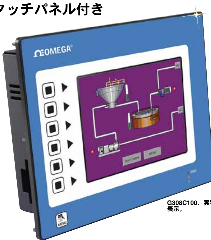
G308C100、実物より小さく表示。

G308オペレーターインタフェース端末は通常ならハイエンド製品に期待されるような優れた機能を低価格で実現しています。G308は高速RS232/422/485通信ポートとイーサネット10 Base T/100 Base-TX通信を使用して多種多様なハードウェアと通信できます。さらに、G308は設定ファイルの高速なダウンロードと、トレンドとデータログの高速なアクセスを可能とするUSBを備えています。付属のコンパクトフラッシュソケットによって、フラッシュカードを使用してトレンドとデータログ情報を取得し、また大きな設定ファイルを保存できます。G308を使用することで、外部リソースのアクセスとコントロールが可能となるだけでなく、情報の閲覧と入力が容易になります。タッチパネルまたはフロントパネルの7ボタンキーボードでデータを入力できます。